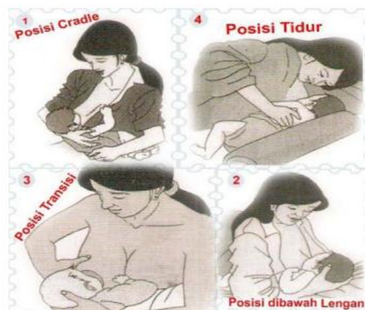
Gambar 2.1 Macam-macam posisi saat menyusui